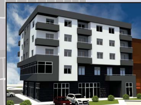
STAMBENO POSLOVNI OBJEKAT CENTAR I